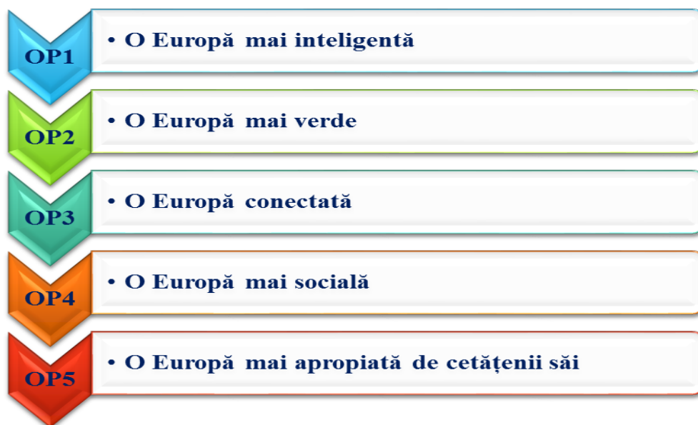
Figura nr. 1 – Priorități de investiții 2021-2027

Europă mai apropiată de cetățenii săi , prin sprijinirea strategiilor de dezvoltare conduse la nivel local și a dezvoltării urbane durabile în UE.